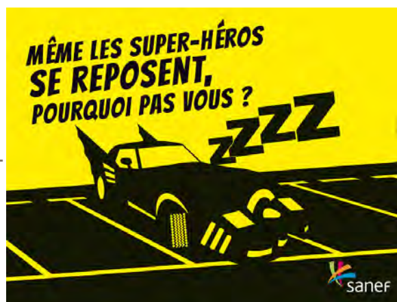
Campagne de sensibilisation au printemps 2012